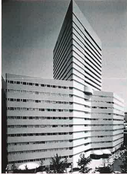
新大阪ワシントンホテルプラザ

新大阪ワシントンホテルプラザ&イベントホール「レルミエール」 大阪市淀川区西中島5-5-15 新大阪セントラルタワー2F TEL:06-6308-8111